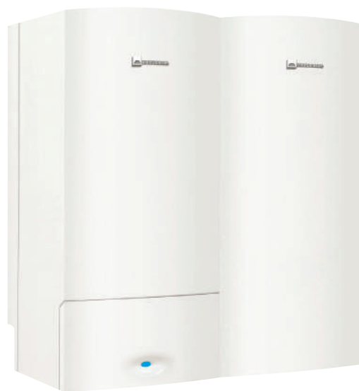
Modèle présenté : chaudière murale avec ballon BIL 50 M accolé.

Ballon monovalent de 150 litres mural ou sol, en inox, avec habillage thermoformé. Il dispose d'un échangeur en inox, d'une trappe de visite et d'une isolation en polystyrène facilement dissociable.