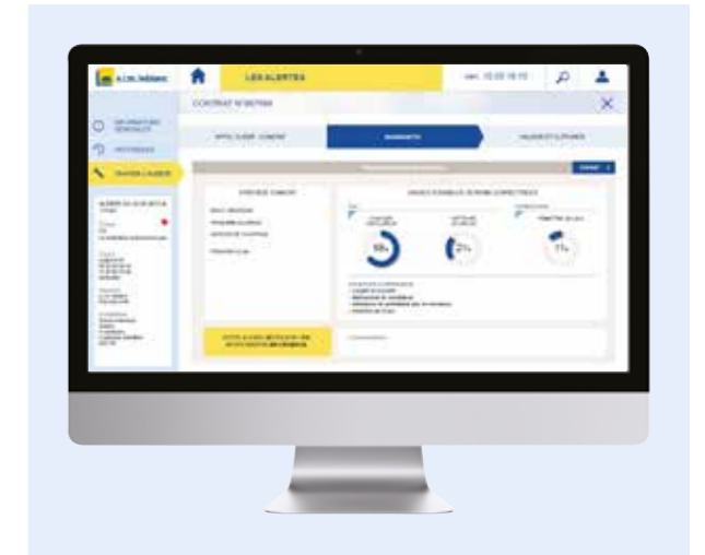
L'interface de la plateforme Optibox dédiée aux entreprises de maintenance, permet de visualiser toutes les chaudières connectées, leur état, les interventions prévues, les dysfonctionnements et les préconisations de remplacement suggérées par le système.

Assurer le confort, la tranquillité d'esprit et la sécurité à coût maîtrisé, c'est l'équation que doivent résoudre au quotidien, les spécialistes de la maintenance des équipements de chauffage. Dans un marché très concurrentiel et en pleine évolution, notamment avec l'essor du bâtiment connecté, Optibox offre aux professionnels, l'opportunité de créer de nouveaux services à valeur ajoutée. La plateforme de gestion Optibox permet l'accès, par l'exploitant, à son parc de chaudières connectées. Il a ainsi la capacité d'optimiser les réglages à distance et est alerté en cas de défaut d'un équipement. Si la nature de celui-ci le permet, il peut effectuer l'intervention à distance et en temps réel. Optibox rend également possible une maintenance prédictive, grâce à l'analyse des données de fonctionnement de la chaudière. Résultat : les interventions sur site sont considérablement réduites et plus efficaces et évitent, notamment, les déplacements nécessaires aux diagnostics.