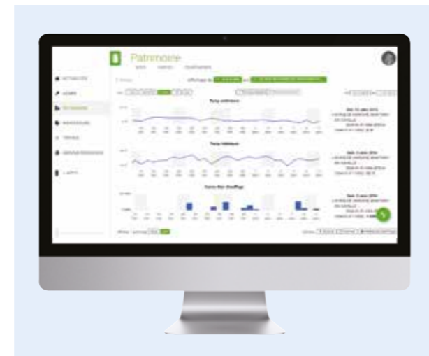
L'interface entre la plateforme « Intent » et le système Optibox d'e.l.m. leblanc facilite l'accès aux données de votre parc de chaudières.

Aujourd'hui, l'un des enjeux des gestionnaires de logements sociaux est de pouvoir adapter le niveau de service défini dans les contrats aux demandes des occupants, en préservant la solvabilité de ces derniers face à l'augmentation du coût des charges et de l'énergie. Avec Optibox , les bailleurs sociaux peuvent offrir à leurs locataires, des services d'optimisation de leur confort et de leur consommation énergétique, tout en réduisant les coûts d'exploitation de leur patrimoine immobilier. Les contrats de maintenance des chaudières installées dans les logements sont supervisés et gérés depuis un bureau, via une plateforme en ligne sécurisée qui donne accès en temps réel et à distance à l'ensemble des chaudières sous contrat.