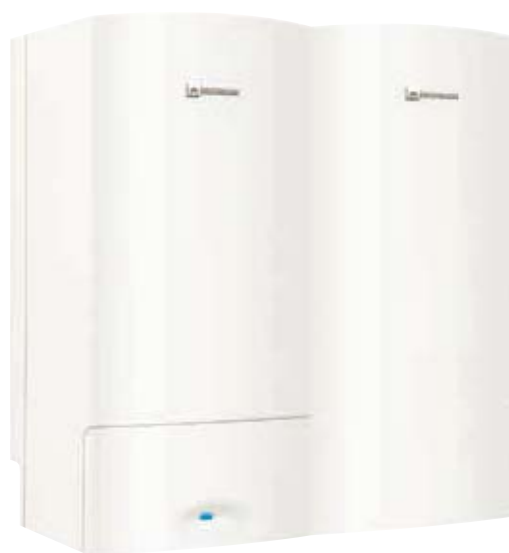
Modèle présenté : chaudière murale avec ballon BIL 50 M accolé.

Ballon monovalent de 150 litres mural ou sol, en inox, avec habillage thermoformé. Il dispose d'un échangeur en inox, d'une trappe de visite et d'une isolation en polystyrène facilement dissociable.